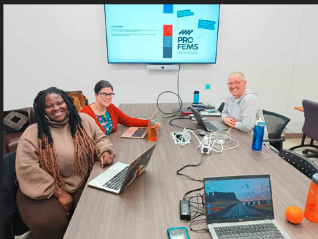
L'équipe PROFEMS en pleine séance de travail.