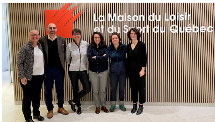
Entretiens Jacques-Cartier avec la délégation française, octobre 2022