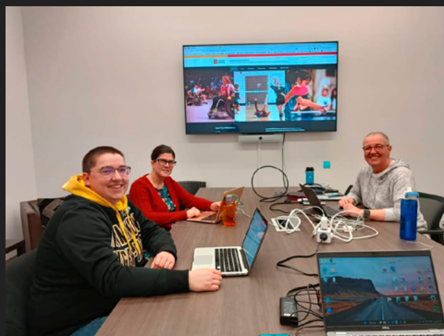
L'équipe PROFEMS en pleine séance de travail.