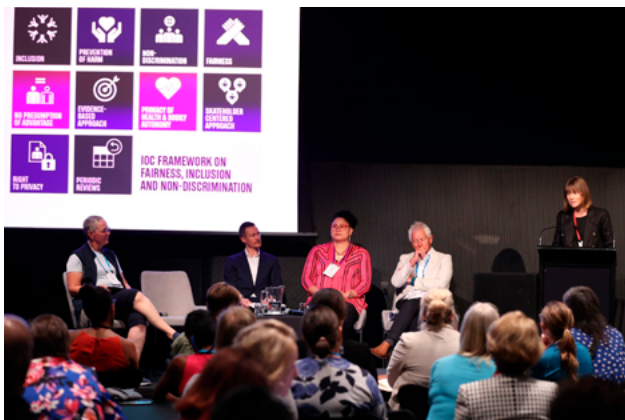
Conférence internationale Femmes et sport (IWG), Nouvelle-Zélande, novembre 2022.

Keyser-Verreault, A. (2022, 16 Mai). Roundtable Northern Blood: The Politics of Menstruation in Canada, Menstruation and sport – Part 1. Canadian Sociological Association Annual Conference. (En ligne)